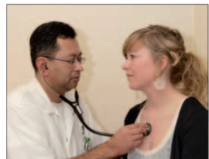
WIZ heeft een goedkope collectieve ziektekostenverzekering voor u.

Let op: voordat de bijstand aan u wordt toegekend onderzoekt WIZ eerst de noodzaak.